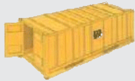
CT 20' DRY